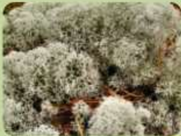
Ягель (олений мох)

Есть стебли и листья, но нет корней и цветков. Размножаются спорами. Живут в сырых местах.